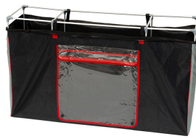
Kit Frame Cargo Back